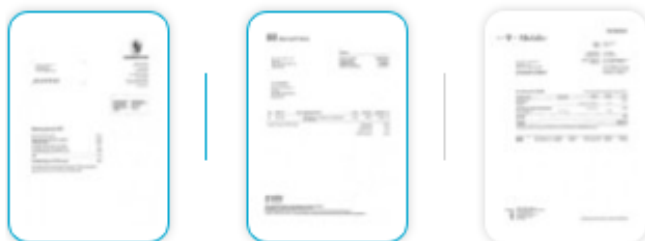
Afbeelding 4: Voorbeeld splits document

Let op: nadat u de documenten heeft gesplitst worden deze automatisch geselecteerd. U kunt de facturen gemakkelijk in één keer taggen (Bulk tag, zie hieronder).