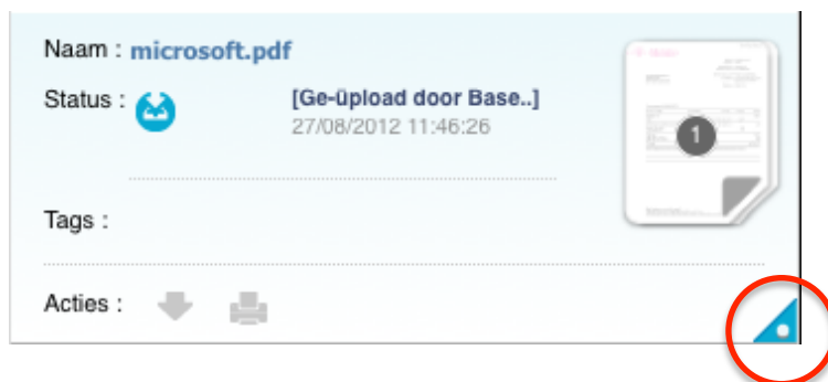
Afbeelding 5: Selecteren van een bestand

U heeft de mogelijkheid meerdere facturen te selecteren en deze in één keer te voorzien van een Tag . De voorwaarde hiervoor is dat alle documenten in de selectie nog niet zijn ge-tagged . U kunt de documenten gemakkelijk selecteren door op de selectiebutton te klikken. Zie hieronder een voorbeeld.